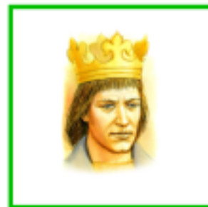
Přemysl Otakar II.