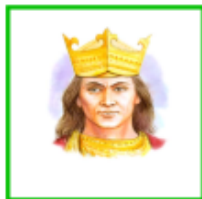
Přemysl Otakar I.